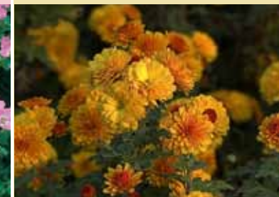
Chrysanthemum x hortorum 'Bienenchen'