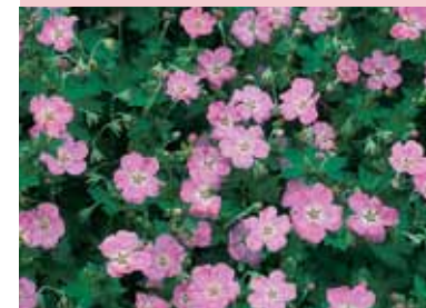
Geranium x riversleaianum 'Mavis Simpson'